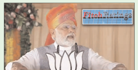
ఫిచ్ రేటింగ్స్ కీలక వ్యాఖ్యలు చేసింది. రానున్న లోక్ సభ ఎన్నికల్లో భజన్ లాల్ నైపుణ్యం మెజారిటీలో గెలుపొందే అవకాశాలు మెండుగా ఉన్నాయని అంచనా వేసింది. తద్వారా వరుసగా మూడోసారి అధికారాన్ని నిలబెట్టుకుంటుందని విశ్వాసం వ్యక్తం చేసింది. ఈ నేపథ్యంలో విధానపరమైన సంస్కరణల పరంపర కొనసాగుతుందని పేర్కొంది. అయితే, భారత్ లో సార్వత్రిక ఎన్నికల్లో అధికారాన్ని దక్కించుకునే పార్టీకి వచ్చే మెజారిటీ.. సంస్కరణల ఎజెండాను ప్రభావితం చేసే అవకాశం ఉందని ఫిచ్ అంచనా వేసింది. ప్రధానమంత్రి నరేంద్ర మోదీ నేతృత్వంలోని భజన్ లాల్ 2014లో స్వచ్ఛమైన మెజారిటీతో అధికారంలోకి వచ్చింది. 2019లోనూ గెలుపొంది అధికారం నిలబెట్టుకుంది. 2024 ఏప్రిల్-మేలో ఎన్నికలు జరగాల్సి ఉంది. ఈసారి కూడా మోదీ ప్రభుత్వమే మళ్లీ ప్రభుత్వ హగ్గాలు చేపడుతుందనేది ఫిచ్ తాజా అంచనా. మరోవైపు జనవరీలో ఎన్నికలు జరగనున్న బంగ్లాదేశ్ లోనూ ప్రస్తుత ప్రభుత్వమే అధికారాన్ని నిలబెట్టుకుంటుందని ఫిచ్ అంచనా వేసింది.

ఫిచ్ అంచనా ఢిల్లీ: భారత్ లో 2024 ఏప్రిల్- మేలో సార్వత్రిక ఎన్నికలు జరగనున్నాయి. ఈ నేపథ్యంలో ఎవరు అధికారంలోకి రానున్నారనే అంశంపై వివిధ రకాల ఊహాగానాలు తెరపైకి వస్తున్నాయి. ఈ తరుణంలో ప్రముఖ ఏజెన్సీ ఫిచ్ రేటింగ్స్ కీలక వ్యాఖ్యలు చేసింది. రానున్న లోక్ సభ ఎన్నికల్లో భజన్ లాల్ నైపుణ్యం మెజారిటీలో గెలుపొందే అవకాశాలు మెండుగా ఉన్నాయని అంచనా వేసింది. తద్వారా వరుసగా మూడోసారి అధికారాన్ని నిలబెట్టుకుంటుందని విశ్వాసం వ్యక్తం చేసింది. ఈ నేపథ్యంలో విధానపరమైన సంస్కరణల పరంపర కొనసాగుతుందని పేర్కొంది. అయితే, భారత్ లో సార్వత్రిక ఎన్నికల్లో అధికారాన్ని దక్కించుకునే పార్టీకి వచ్చే మెజారిటీ.. సంస్కరణల ఎజెండాను ప్రభావితం చేసే అవకాశం ఉందని ఫిచ్ అంచనా వేసింది. ప్రధానమంత్రి నరేంద్ర మోదీ నేతృత్వంలోని భజన్ లాల్ 2014లో స్వచ్ఛమైన మెజారిటీతో అధికారంలోకి వచ్చింది. 2019లోనూ గెలుపొంది అధికారం నిలబెట్టుకుంది. 2024 ఏప్రిల్-మేలో ఎన్నికలు జరగాల్సి ఉంది. ఈసారి కూడా మోదీ ప్రభుత్వమే మళ్లీ ప్రభుత్వ హగ్గాలు చేపడుతుందనేది ఫిచ్ తాజా అంచనా. మరోవైపు జనవరీలో ఎన్నికలు జరగనున్న బంగ్లాదేశ్ లోనూ ప్రస్తుత ప్రభుత్వమే అధికారాన్ని నిలబెట్టుకుంటుందని ఫిచ్ అంచనా వేసింది.