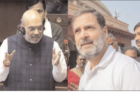
కోసం ఏళ్ల తరబడి జైల్లో ఉన్నారు. అమిత్ షాకు చరిత్ర తెలియదు. తెలుసుకుంటారని కూడా నేను అనుకోను. అందుకే పదే పదే దాన్ని తిరగరాస్తూనే ఉన్నాను" అని రాహుల్ కౌంటర్ ఇచ్చారు. దేశంలో నెలకొన్న ప్రధాన సమస్యల నుంచి ప్రజలను తప్పదేవ పట్టించేందుకే భజన్ లాల్ ఆరోపణలు చేస్తోందని రాహుల్ అన్నారు. "కుల గణన, నిరుద్యోగం, దేశంలోని ధనమంతా ఎవరి చేతుల్లో ఉంది.. ఇవన్నీ ప్రధాన అంశాలు. వీటిపై చర్చించేందుకు బీజేపీ భయపడుతోంది. అందుకే వీటి నుంచి పారిపోతోంది" అని రాహుల్ ఎద్దేవా చేశారు. రాజ్యసభలో జమ్మకశ్మీర్ బిల్లులపై చర్చ సందర్భంగా అమిత్ షా మాట్లాడుతూ.. "కేవల ఒకేవ్యక్తి పాఠశాల వల్ల భారత్ లో జమ్మకశ్మీర్ భాగం కావడం అలస్యమైంది" అంటూ వ్యాఖ్యలు చేశారు. ఈ వ్యాఖ్యలపై కాంగ్రెస్ పార్టీ నైతం భగ్గుమంది. ఇదిలా ఉంటే.. జమ్మకశ్మీర్ పునర్వ్యవస్థీకరణ (సవరణ), జమ్మకశ్మీర్ రిజిస్ట్రేషన్ (సవరణ) బిల్లులకు కేంద్రం రూపం తెచ్చింది. కశ్మీర్ శరణార్థుల నుంచి ఇద్దరిని, పాక్ ఆక్రమిత కశ్మీర్ నిర్వాసితుల నుంచి ఒకరిని శాసనసభకు నామినేట్ చేసేందుకు, కొన్ని వర్గాలకు రిజిస్ట్రేషన్ ఇచ్చేందుకు ఈ బిల్లులు వీలు కల్పిస్తాయి. లోక్ సభ కిందటి వారమే ఈ బిల్లుల్ని అమోదించగా.. రాజ్యసభలో సోమవారం దాదాపు నాలుగు గంటల చర్చ తర్వాత అమోదం లభించింది. తర్వాతి దశలో రాష్ట్రపతి అమోదంతో ఈ బిల్లులు చట్టంగా మారనున్నాయి.