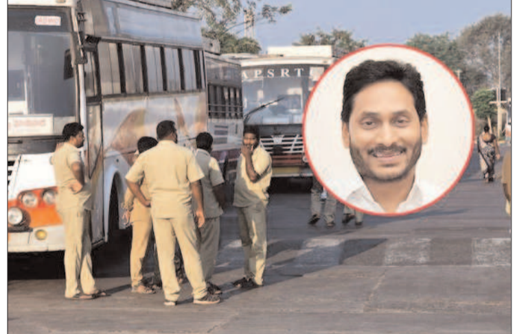
సంగతి తెలిసిందే. వచ్చే నెల నుంచి జీతాలతో పాటు అలవెన్సుల చెల్లింపు జరపనుంది ప్రభుత్వం. ఈ మేరకు అధికారులకు సీఎం జగన్ ఆదేశాలు సైతం జారీ చేశారు. ఈ నిర్ణయం పట్ల ఉద్యోగులు అంతటా హర్షం వ్యక్తం చేస్తూ.. సీఎం జగన్ కు కృతజ్ఞతలు చెబుతున్నారు.

జగన్మొదటి ఉద్దేశ్యం ధ్వంసం గంటూరు: ఆంధ్రప్రదేశ్ రోడ్డు రవాణా సంస్థ ఉద్యోగులు ప్రభుత్వ నిర్ణయం పట్ల హర్షం వ్యక్తం చేస్తున్నారు. ఉద్యోగుల డిమాండ్ల పరిష్కారానికి ప్రభుత్వం కీలక నిర్ణయం తీసుకున్నా సంగతి తెలిసిందే. వచ్చే నెల నుంచి జీతాలతో పాటు అలవెన్సుల చెల్లింపు జరపనుంది ప్రభుత్వం. ఈ మేరకు అధికారులకు సీఎం జగన్ ఆదేశాలు సైతం జారీ చేశారు. ఈ నిర్ణయం పట్ల ఉద్యోగులు అంతటా హర్షం వ్యక్తం చేస్తూ.. సీఎం జగన్ కు కృతజ్ఞతలు చెబుతున్నారు. పార్టీ శాసనసభా పక్ష నేతగా ఎన్నుకుంటూ నిర్ణయం తీసుకున్నారు. ఇక, ఇద్దరు ఉపముఖ్యమంత్రులను కూడా ప్రకటించారు. దియా సింగ్ కుమారి, ప్రేమ్ చంద్ బిర్లా డిప్యూటీ సీఎంలుగా బాధ్యతలు చేపట్టనున్నారు. బ్రాహ్మణ వర్గానికి చెందిన భజన్ లాల్ శర్మ ప్రస్తుతం భజన్ లాల్ రాష్ట్ర ప్రధాన కార్యదర్శిగా వ్యవహరిస్తున్నారు. నాలుగు సార్లు ఆయన ఈ పదవి చేపట్టారు. ఇప్పటివరకు పార్టీలో సంస్కారంగా కీలక వ్యవహారం జరిగిన భజన్ లాల్.. ఇటీవల జరిగిన ఆసెంబ్లీ ఎన్నికల్లో పోటీ చేశారు. సంగనేరీ నుంచి పోటీ చేసిన ఆయన.. తన సమీప కాంగ్రెస్ అభ్యర్థిపై 48వేల ఓట్లకు పైగా మెజారిటీతో విజయం సాధించారు. ఆయన ఆసెంబ్లీకి ఎన్నికవ్వడం ఇదే తొలిసారి. భజన్ లాల్ తులసిపేటి మంచి అనుబంధం. గతంలో ఏటీఎస్ నేతగా వ్యవహరించారు. 56వేల భజన్ లాల్ పీఠి పూర్తి చేశారు. ఆయనపై ఎలాంటి క్రిమినల్ కేసులు లేవు.