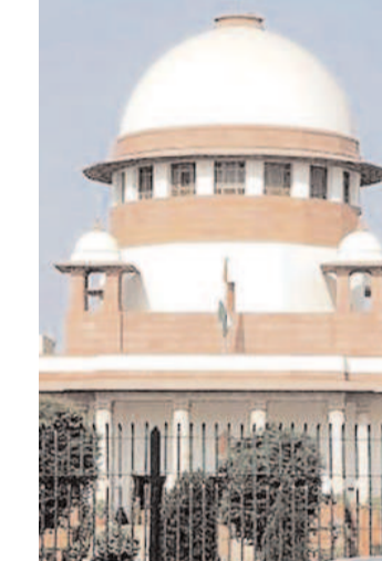
ఫైబర్ నెట్ కేసులో తెదేపా అధినేత చంద్రబాబు దాఖలు చేసిన ముందస్తు బెయిల్ పిటిషన్పై సుప్రీంకోర్టులో విచారణ జరిగింది. తదుపరి విచారణను సుప్రీంకోర్టు జనవరి 17వ తేదీకి వాయిదా వేసింది.

సుప్రీంకోర్టుకు తెలిపారు. ప్రభుత్వం తరపునే దిల్లీ సహా పలు ప్రదేశాల్లో అదనపు ఏజీ, సిబిడి డీజీ మీడియా సమావేశాలు నిర్వహించారన్నారు. వారు ప్రెస్ మీట్ నిర్వహించడం వూర్తిగా తప్పు అని చెప్పారు. మీడియా సమావేశాల్లో నిరాధార ఆరోపణలు చేశారని.. వాటితో పోలిస్తే చంద్రబాబు ఎక్కడా ఎలాంటి వ్యాఖ్యలూ చేయలేదని సిద్ధార్థ లూథ్రా కోర్టుకు తెలిపారు.