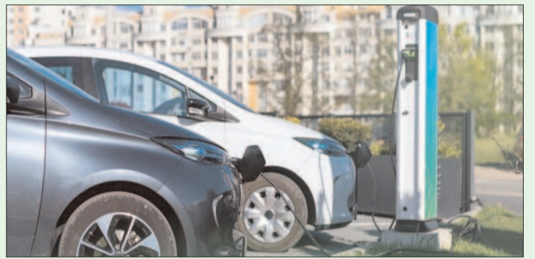
ఛార్జింగ్ స్టేషన్స్ లిమిటెడ్ తో ఒప్పందం కుదుర్చుకుంది. దీని గురించి మరిన్ని వివరాలు ఈ కథనంలో తెలుసుకుందాం. టాటా పవర్ అనుబంధ సంస్థ TPEVCSL దేశంలో ఛార్జింగ్ స్టేషన్స్ సంఖ్యను పెంచడానికి IOCLతో చేతులు కలిపింది. ఈ ఒప్పందం ప్రకారం ఈ రెండూ కలిసి దేశవ్యాప్తంగా సుమారు 500 కంటే ఎక్కువ స్టేషన్లు, అల్ట్రా-ఫాస్ట్ ఎలక్ట్రిక్ వెహికల్ (ఈవీ) ఛార్జింగ్ స్టేషన్లు పాయింట్లను ఇన్స్టాల్ చేయనున్నాయి. త్వరలో ఇన్స్టాల్ చేయనున్న ఈవీ ఛార్జింగ్ స్టేషన్లు ముంబై, ఢిల్లీ, కోల్ కతా, బెంగళూరు, అహ్మదాబాద్, పూణే, కొచ్చి వంటి ప్రధాన నగరాల్లో మాత్రమే కాకుండా.. ముంబై-పూణే ఎక్స్ ప్రెస్ వే, సెలం-కొచ్చి హైవే, గుంటూరు-చెన్నై హైవే వంటి ప్రధాన రహదారులపై ఉన్న 'ఇండియన్ ఆయిల్ కార్పొరేషన్ లిమిటెడ్' అవుట్ లెట్ లలో ప్రారంభించనున్నారు. ఎలక్ట్రిక్ వాహనాల్లో లాంగ్ జర్నీ చేయాలనుకునే వారికి ఈ కొత్త ఛార్జింగ్ స్టేషన్లు చాలా ఉపయోగకరంగా ఉంటాయని, 'టాటా పవర్ ఈజెడ్ ఛార్జ్ యాప్ ద్వారా లేదా 'ఇండియన్ ఆయిల్ ఈ-ఛార్జ్' మొబైల్ యాప్ ద్వారా ఛార్జింగ్ స్టేషన్స్ గురించి సమాచారం తెలుసుకోవచ్చని టాటా పవర్ బిజినెస్ డెవలప్ మెంట్ -ఈవీ ఛార్జింగ్ సాల్ షింగ్ గ్రూప్ లో తెలిపారు. ఎలక్ట్రిక్ వాహనాల వృద్ధి పెరుగుతున్న సమయంలో ఛార్జింగ్ స్టేషన్ల సంఖ్య కూడా పెరగాల్సి ఉంది. ప్రస్తుతం దేశవ్యాప్తంగా సుమారు 6000 కంటే ఎక్కువ ఛార్జింగ్ స్టేషన్లు ఉన్నట్లు, వీటి సంఖ్యను 2024 నాటికి 10000 చేర్చడానికి కంపెనీ కృషి చేస్తున్నట్లు సమాచారం. అనుకున్నవన్నీ సక్రమంగా జరిగితే రానున్న రోజుల్లో ఎలక్ట్రిక్ వాహనాలకు ఛార్జింగ్ సమస్యలు దాదాపు తొలగిపోతాయని స్పష్టంగా తెలుస్తోంది.