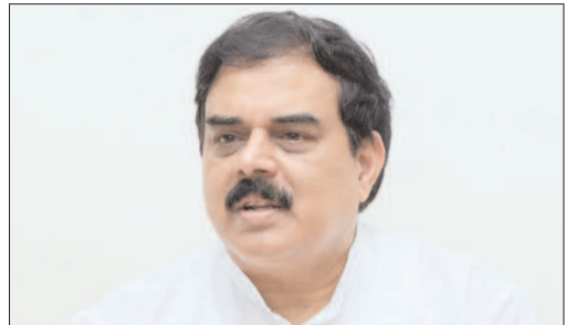
కార్యక్రమంలో పురోగతి లేదు. నాడు-నేడు రెండో విడతలో 13,860 అదనపు పాఠశాల గదులు నిర్మిస్తున్నారు. కానీ,