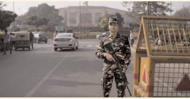
దిట్టి: ఇటీవల లోక్ సభలోకి దుండగులు ప్రవేశించి రంగుల పాగతో సృష్టించిన అలజడితో యావత్ దేశం ఉలిక్కిపడింది. ఈ ఘటనతో పార్లమెంట్ భద్రతపై అనేక సందేహాలు తలెత్తాయి. ఈ క్రమంలోనే కేంద్ర ప్రభుత్వం కీలక నిర్ణయం

పార్లమెంట్ భవన భద్రత బాధ్యతలను సింట్రిల్ ఇండస్ట్రీయల్ సెక్యూరిటీ ఫోర్స్ కు అప్పగించాలి