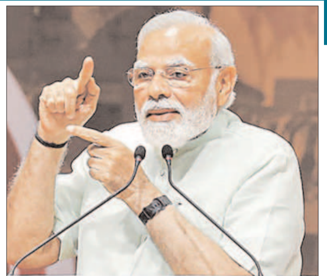
భారత్ లో కొన్ని వర్గాలపై వివక్ష చూపుతున్నారనే వాదనను ప్రధాని మోదీ తోసిపుచ్చారు. అవి కేవలం ఆరోపణలు మాత్రమేనని అన్నారు.

దిట్టి: భారత్ లో కొన్ని వర్గాలపై వివక్ష చూపుతున్నారనే వాదనను ప్రధాని మోదీ తోసిపుచ్చారు. ఈ మేరకు ఆంగ్ల పత్రిక 'మైనార్టీస్ టైమ్స్'కు ఇచ్చిన ఇంటర్వ్యూలో వ్యాఖ్యలు చేశారు. భారత్ లోని మైనార్టీ వర్గాలపై వివక్ష గురించి అడిగిన ప్రశ్నకు మోదీ సమాధానమిచ్చారు. భారత జనాభాలో అతి తక్కువ శాతం ఉన్న పార్సీ ప్రజల ఆర్థిక ప్రగతిని ఉదహరించారు. అలాగే, కొన్ని మైనార్టీ వర్గాలు తమ జీవనానికి భారత్ సురక్షితమైన దేశంగా భావించి ఇక్కడే స్థిరపడ్డాయన్నారు. భారతీయ సమాజం ఏ మతం, మైనార్టీ వర్గంపై వివక్ష చూపటం లేదని స్పష్టం చేశారు. భారత్ లో మైనార్టీలను అణిచివేస్తున్నారన్న విమర్శలపై కూడా ప్రధాని మోదీ స్పందించారు. వివిధ రకాల వేదికలపై విమర్శకులు తమ అభిప్రాయాన్ని స్వేచ్ఛగా వెల్లడిస్తారు. అలాంటివి ప్రజల ఆరోపణలకు సమాధానం చెప్పి.. వాటిని ఖండించే హక్కు కూడా అవతలి పక్షానికి ఉంటుందని ప్రధాని గుర్తుచేశారు. భారత్ లో ప్రజాస్వామ్యం బలహీనంగా ఉందన్న విమర్శలను ప్రధాని తోసిపుచ్చారు. అలాంటి ఆరోపణలు చేయడం అంటే.. ప్రజాస్వామ్య విలువలపై పౌరులకున్న నిబద్ధతను చలకన చేసినట్లే అని అన్నారు. అదే విధంగా దేశ ప్రజల ఆకాంక్షలను నెరవేర్చేందుకు భాజపా కట్టుబడి ఉందన్నారు. గత దశాబ్ద కాలంలో భారత్ అభివృద్ధి పథంలో